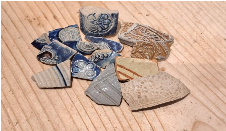
Aardewerk, fragmenten Steengoed, stukje Beardmankruik. Gevonden langs de oever van het IJsselmeer en Wallenvesting. Datering: Late Middeleeuwen/Nieuwe Tijd.