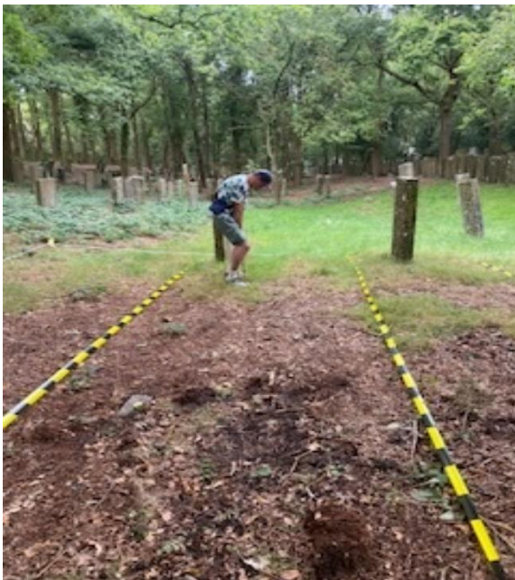
Op de foto: Vrijwilligers aan het werk op de Joodse begraafplaats Muiderberg.