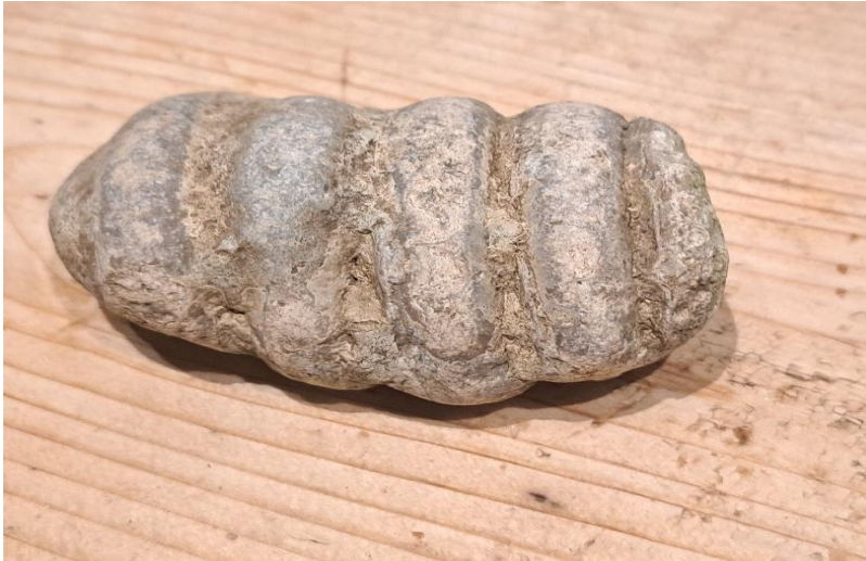
Fossil. Gevonden langs de oever van IJsselmeer tussen Muiderberg en Muiden.

Ook werd er op de Vondstenavond een schrabbertje/krabbertje meegenomen voor determinatie. Het werd gevonden op het strand bij Almere. Leuk!