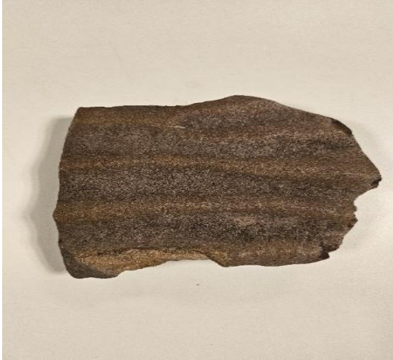
Op de foto: Een stukje versteende zeebodem. Vindplaats: Drenthe.

Ook werd op deze vondstenavond een stukje grofgeribbeld zandsteen meegebracht dat werd gevonden in Drenthe. Onze expert kon ons vertellen dat het ging om versteende zeebodem. Wat ooit los zeebodemzand was met kleine organismen in een vroege periode van de aarde, transformeerde tot keiharde zandsteen. Ooit werd het zandsteen waarschijnlijk meegenomen met gletsjers uit Zuid-Scandinavië. In Zuid-Scandinavië liggen namelijk op veel plekken zandsteenlagen aan het oppervlak.