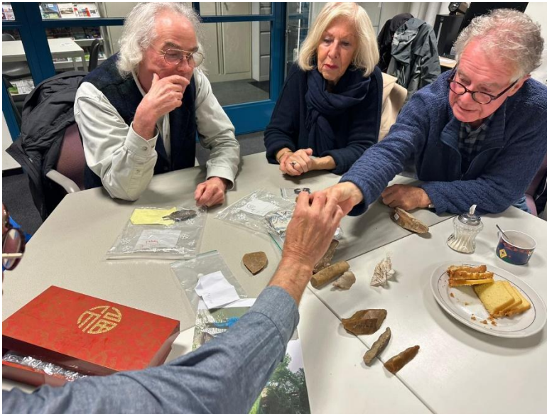
Leden en geïnteresseerden op de vondstenavond Naerdincklant in oktober 2024.

Ook op de vondstenavond in het najaar kwam er wat moois voorbij: vier tinnen lepels. Deze lepels werden ooit gevonden in een Amsterdamse bouwput en bleven in de familie bewaard. De lepels dateren zo van rond 1600 – 1650. Eén van de lepels was voorzien van de inscriptie: London en drie symbolen.