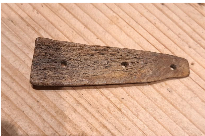
Mesheft van hertengewei. gevonden langs de oever van IJsselmeer tussen Muiden en Muiderberg.