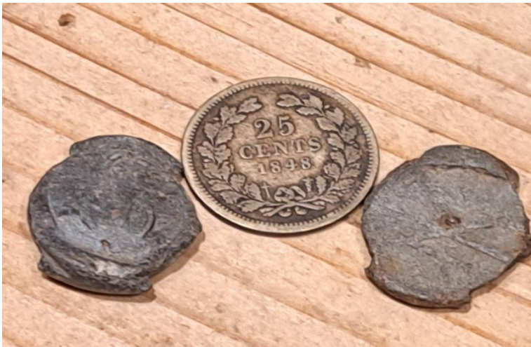
Gevonden tijdens een wandeling op de wallen in Naarden Vesting: Lakenmuntje en muntje van 25 cent uit 1848. Datering: Nieuwe Tijd.

Laurie had in de omgeving van Muiden, Naarden, Muiderberg en Weesp verschillende artefacten gevonden. Het gaat hier om vondsten uit stortmateriaal: grond dat ergens anders vandaan komt en elders is gestort om als bouw materiaal te dienen. Het ligt er aan waar de grond vandaan komt, maar wie goed zoekt, kan wat interessants tegenkomen.