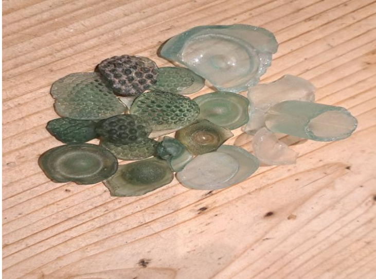
Glaswerk gevonden langs de oever van het IJsselmeer tussen Muiderberg en Muiden.