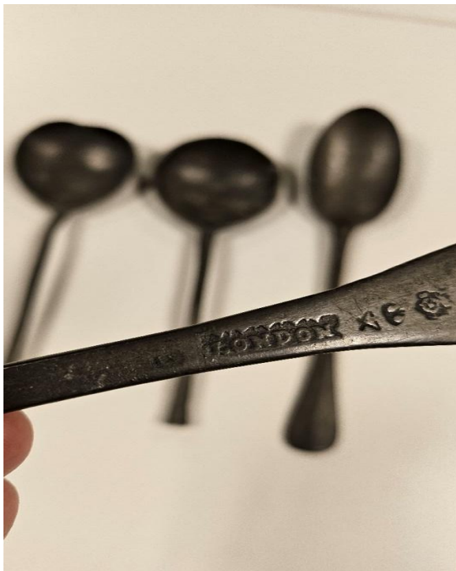
Tinnen lepels uit de 17 e eeuw. Vindplaats: Amsterdam.

Ook op de vondstenavond in het najaar kwam er wat moois voorbij: vier tinnen lepels. Deze lepels werden ooit gevonden in een Amsterdamse bouwput en bleven in de familie bewaard. De lepels dateren zo van rond 1600 – 1650. Eén van de lepels was voorzien van de inscriptie: London en drie symbolen.