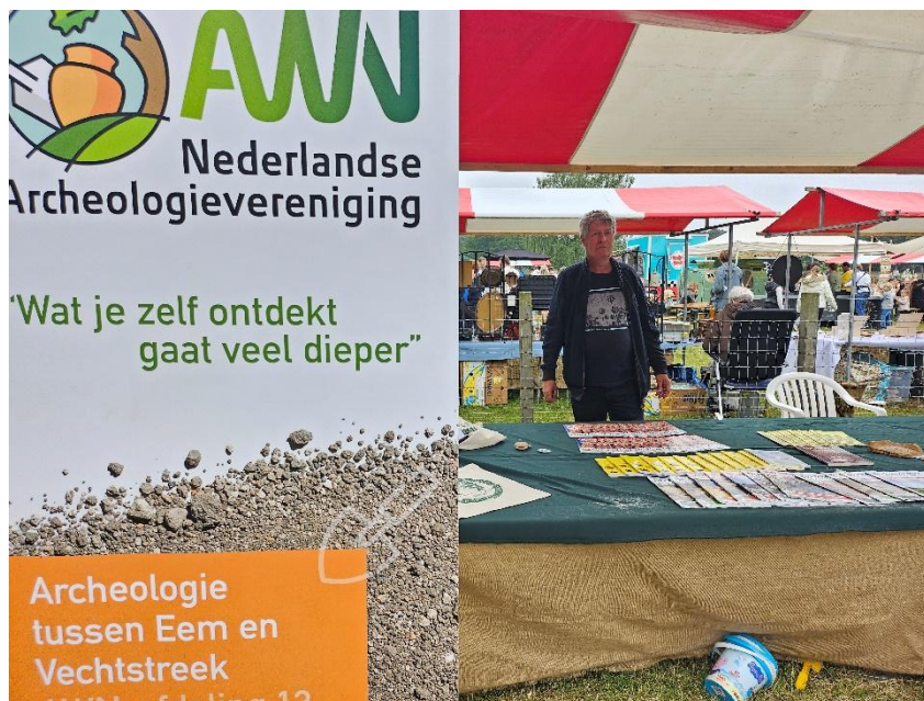
De stand van AWN Naerdincklant op het Schaapscheerdersfeest 2024 in Blaricum.

De schapen worden één keer per jaar geschoren op ambachtelijke wijze. Op het terrein bij de schaapskooi is altijd een gezellige markt met kramen en foodtrucks. Er worden demonstraties gegeven en er zijn leuke activiteiten voor kinderen.