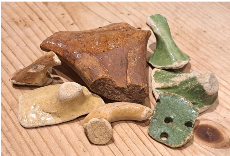
Groen geglazuurd aardewerk, fragment vergiet, handvat steelpan. Gevonden langs de oever van het IJsselmeer en Wallenvesting. Datering: Late Middeleeuwen/Nieuwe Tijd.