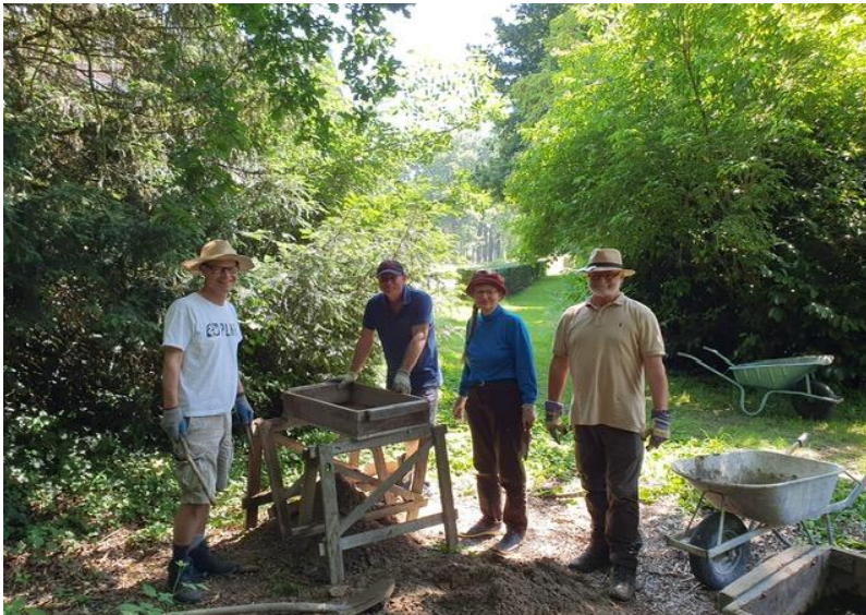
Op de foto's: Vrijwilligers aan het werk bij kasteel de Nederhorst.