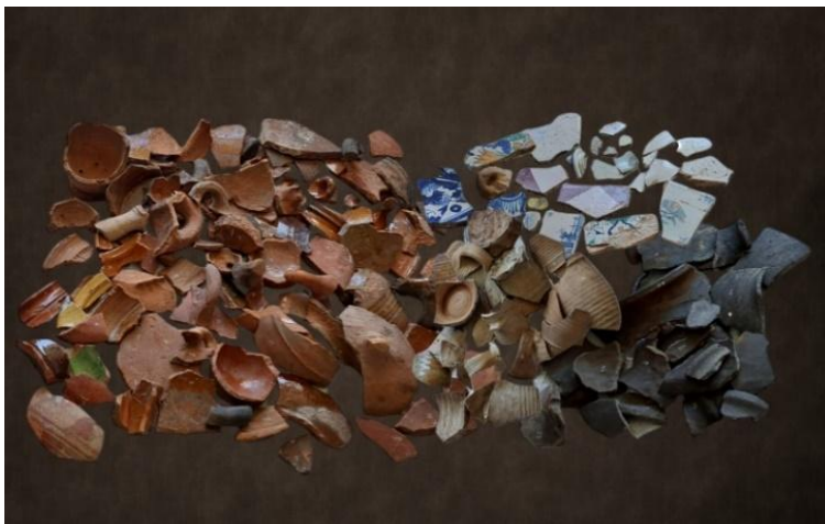
Aardewerkscherven ArcheoHotspot Vestingmuseum Naarden.

De ArcheoHotspot vindt elk tweede weekend van de maand plaats in het Nederlands Vestingmuseum te Naarden. De Hotspot is geopend van 13:00 tot 16:00 uur. Meer weten? Zie www.vestingmuseum.nl . ArcheoHotspots.nl is een platform van PAN (Portable Antiquities of the Netherlands) en Stichting ArcheoHotspots. Meer weten? Zie: https://archeohotspots.nl