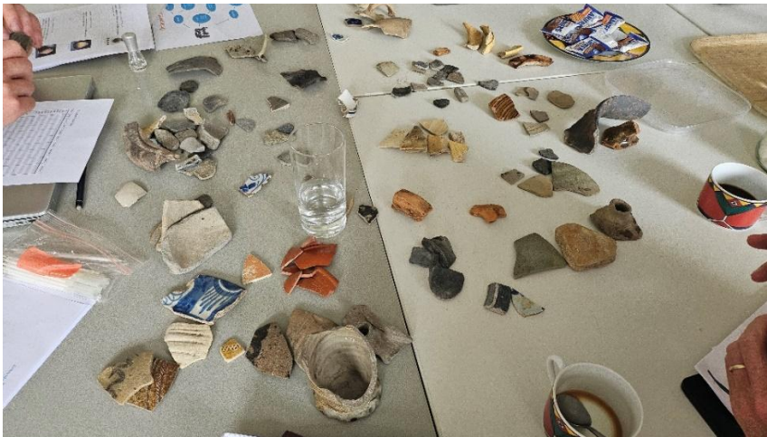
Op de foto: Aan de slag met sorteren en determineren van aardewerk tijdens de workshop.