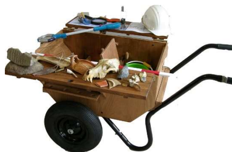
De Tilburgse 'leskist' archeologie.

Om 11.00 uur wordt er voor de wat ouderen een rondleiding gegeven door het Paleis en gedurende de hele dag kan Expo Tilburg 2050 worden bezocht. Dat is een presentatie over de planologie van Tilburg in verleden, heden en toekomst.