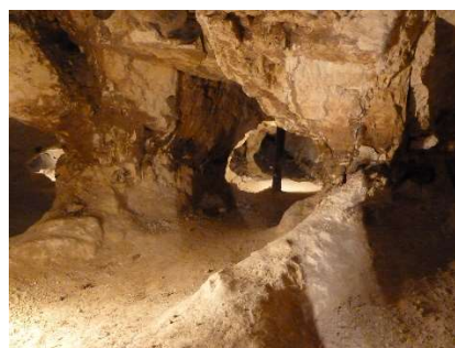
Een tunnel in de vuursteenmijn.

De weersverwachting was 'regenachtig', maar het bleek een mooie zonnige dag en het bos was op zijn mooist met volop daslook in bloei. Na afloop volop positieve reacties en ook financieel is deze excursie goed uitgekomen. Alle reden dus om vooruit te kijken naar meer.