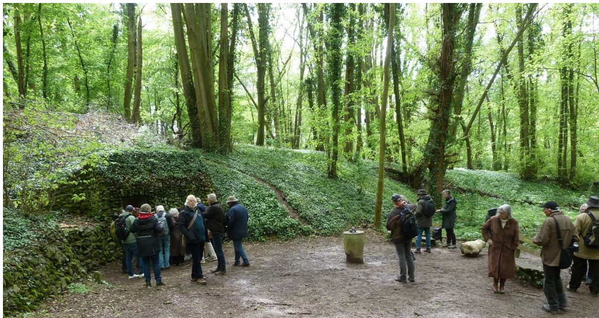
Verzamelen voor de ingang van de vuursteenmijn.

Op 20 april brachten we een zeer geslaagd bezoek aan de Vuursteenmijn in Rijckholt, Zuid-Limburg. Met een goed gevulde bus met opstappers in Tilburg en Eindhoven en met enkele deelnemers die op eigen gelegenheid naar Rijckholt waren gekomen, zaten we aan de maximale groepsgrootte van 45 personen. Deelnemers waren AWN-leden (Midden-Brabant, AVKP en elders), de Steentijdwerkgroep en leden van de Heemkundekring Tilborch.