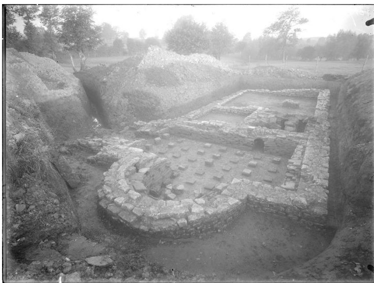
Het badhuis van de villa van Lemiers tijdens de opgravingen in 1928-1930.