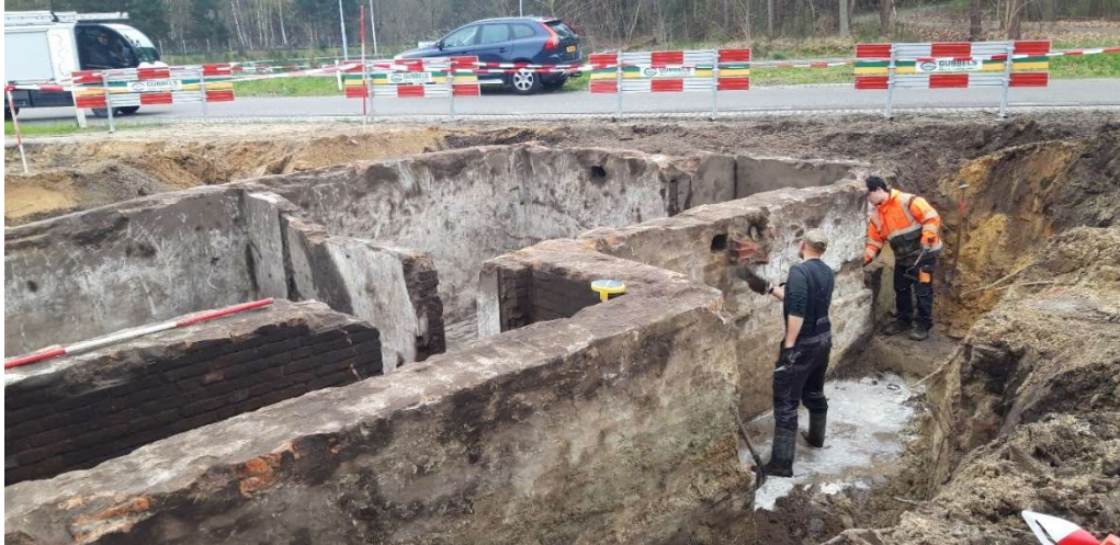
Het schoonmaken en inmeten van de funderingen van de kantine door BAAC.