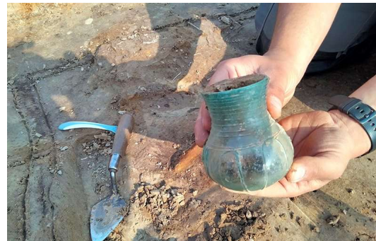
De opgraving in Hilvarenbeek en één van de bijzondere vondsten.